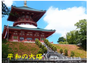
成田山の参道には、十二支像が飾られていますよ♪