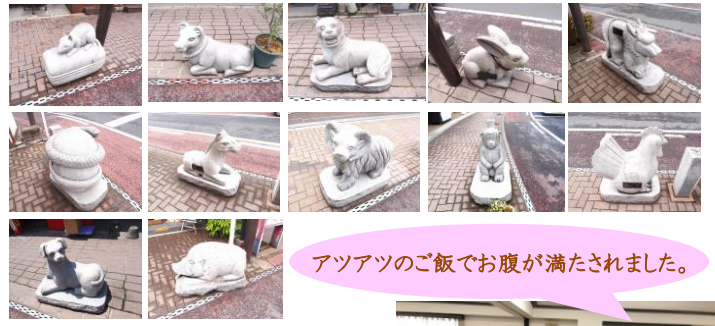
アツアツのご飯でお腹が満たされました。